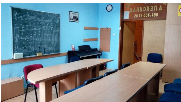
Учионица у канцеларији месне заједнице