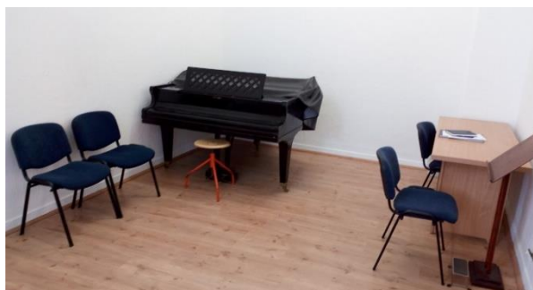
Учионица бр.2 у новим просторијама