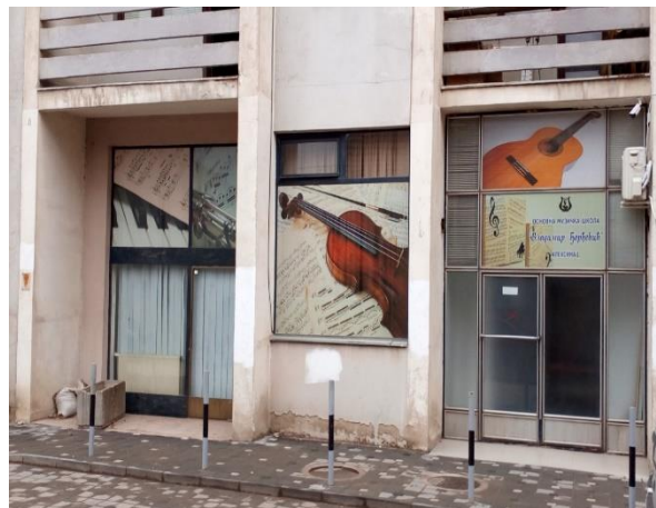
Просторије на северној страни комплекса зграда