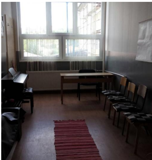
Учионица за наставу клавира у Ражњу