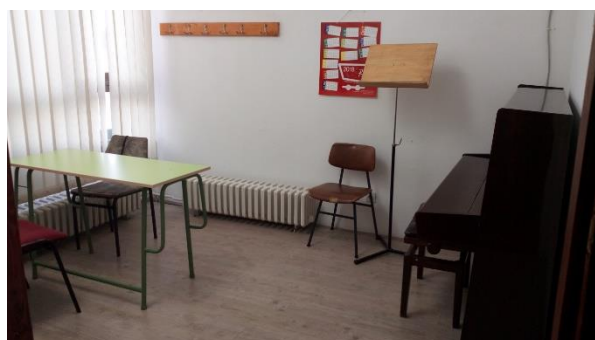
Учионица за наставу кларинета