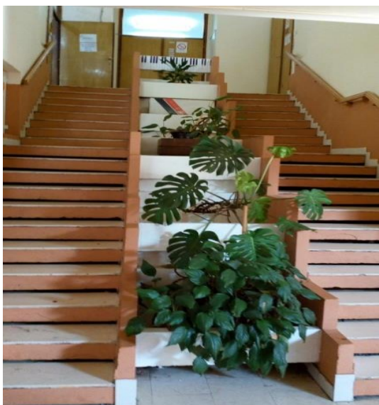
Улаз у школу из хола ЦКУ