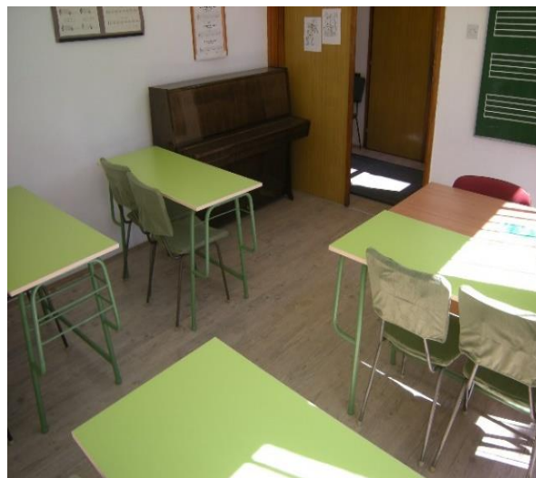
Учионица бр 2 у матичној школи