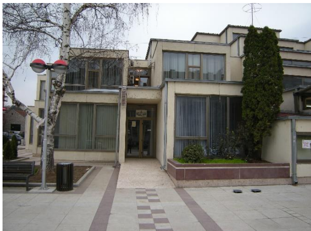
Улаз у школу – лево крило зграде ЦКУ Алексинац