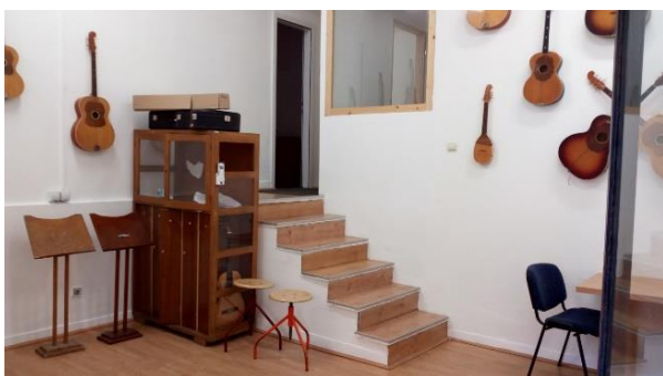
Учионица бр.1 у новим просторијама